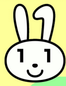
何が入ってるかな！？