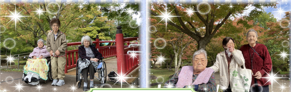
猪苗代から磐梯町を散策