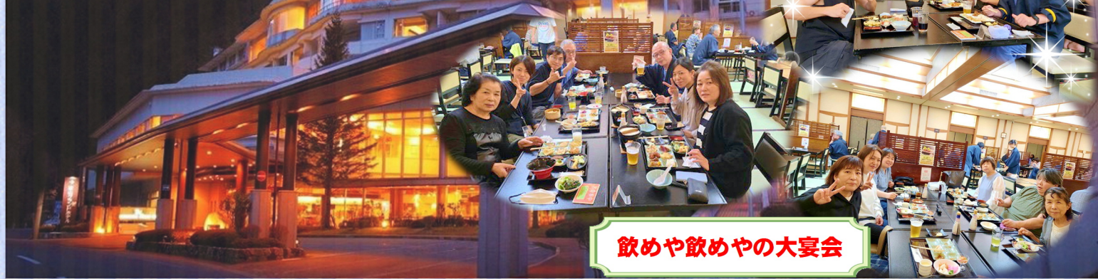
飲みや飲みやの大宴会

職員旅行が開催されました! 10月17日・24日に分けて、東山グランドホテルに 宿泊してきました。 リフレッシュしてサービス向上に努めます!