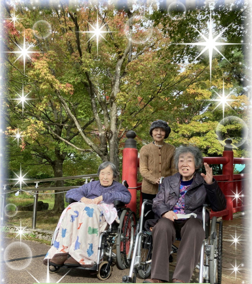
アイスをください!?

職員旅行が開催されました! 10月17日・24日に分けて、東山グランドホテルに 宿泊してきました。 リフレッシュしてサービス向上に努めます!